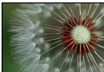
Diente de León